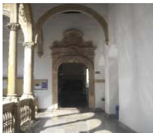
Entrada del Ser de Gestión de Investigación

LAC (Paradas “Marqués de Falces” y “Padre Suárez”)