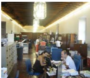
Personal en las oficinas del servicio