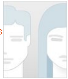
Ficha del Directorio