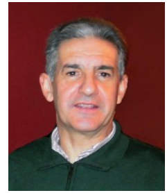
Ficha del Directorio