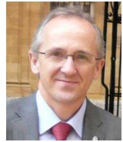
Ficha del Directorio