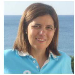
Ficha del Directorio