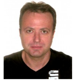
Ficha del Directorio