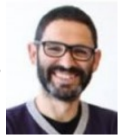
Ficha del Directorio