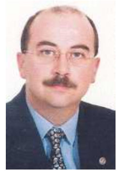
Ficha del Directorio