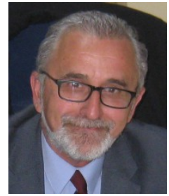
Ficha del Directorio