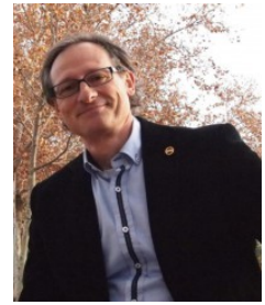
Ficha del Directorio