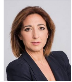
Ficha del Directorio

Grupo de Investigación: GEA. CULTURA MATERIAL E IDENTIDAD SOCIAL EN LA PREHISTORIA RECIENTE DEL SUR DE LA PENÍNSULA IBÉRICA (Cod.: HUM065)