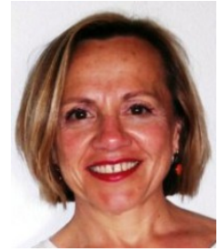
Ficha del Directorio