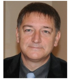
Ficha del Directorio

Grupo de Investigación: GRUPO ANDALUZ DE INVESTIGACION EN SALUD MENTAL (Cod.: CTS322)