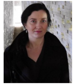
Ficha del Directorio