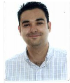
Ficha del Directorio