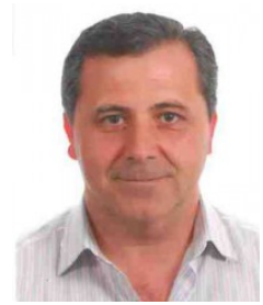
Ficha del Directorio