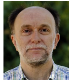
Ficha del Directorio

Grupo de Investigación: DIDÁCTICA DE LAS CIENCIAS EXPERIMENTALES Y DE LA SOSTENIBILIDAD (Cod.: HUM613)