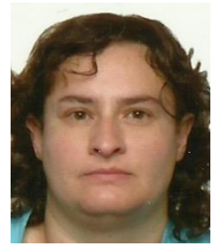
Ficha del Directorio

Grupo de Investigación: MODELLING & DEVELOPMENT OF ADVANCED SOFTWARE SYSTEMS (Cod.: TIC230)