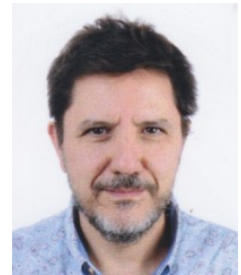
Ficha del Directorio