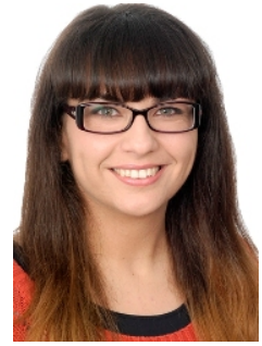
Ficha del Directorio