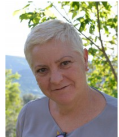
Ficha del Directorio